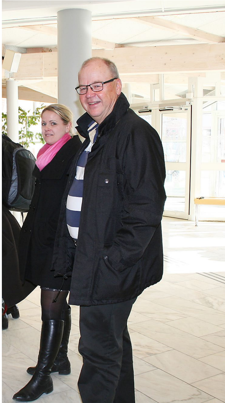
jämför det med priset för ett Jas-plan.