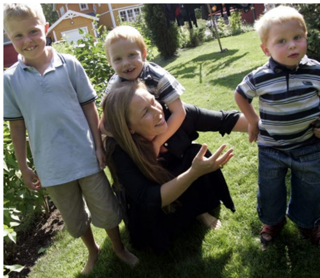
Befolkningen i Sverige ökar mer än någonsin.